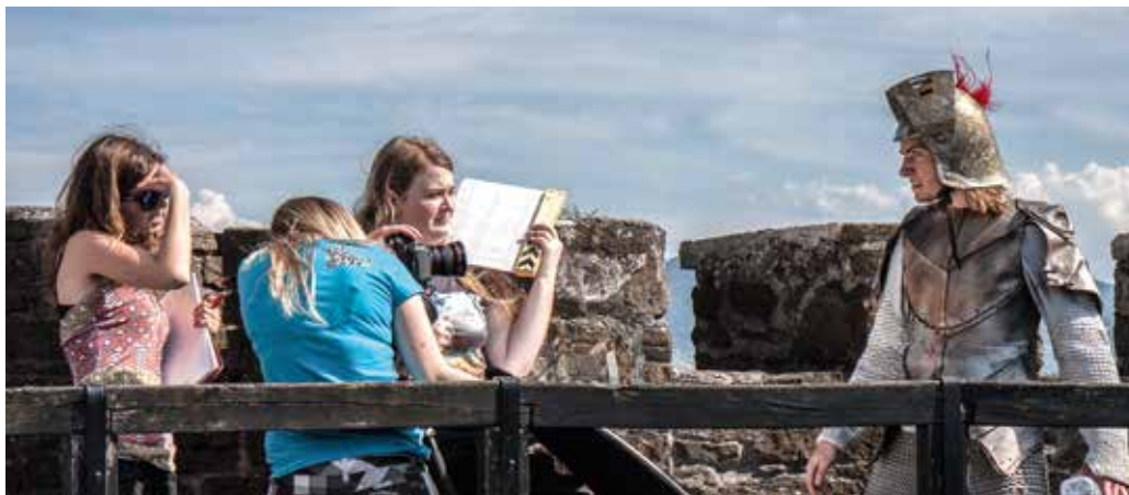
Študenti so ob pomoči mentorjev samostojno zasnovali, posneli in dokončali promocijski film univerze.

Praktično usmerjeni triletni program prve stopnje Digitalne umetnosti in prakse ter nadaljevanje na dvoletnem programu druge stopnje Medijske umetnosti in prakse omogočata tri smeri raziskovanja v okoljih filma, kreativnih industrij in sodobnih umetnosti .