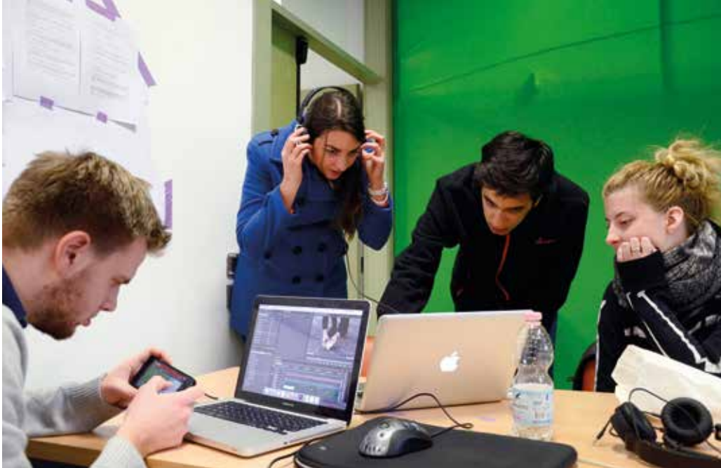
Na mednarodni delavnici Iškanje ravnovesja na meji z norveškimi in portugalskimi študenti ter mentorji.