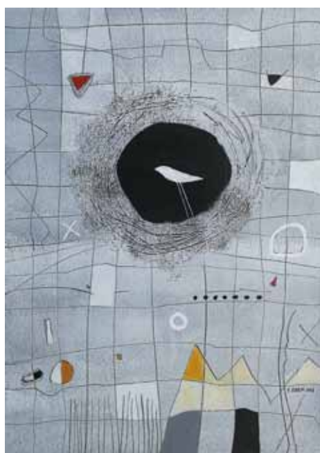
SILVA KARIM Gnezdo, 2018 akril na platnu