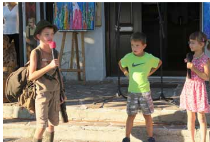
Mladi z gore so obiskovalce nasmejali ..., kot vedno.