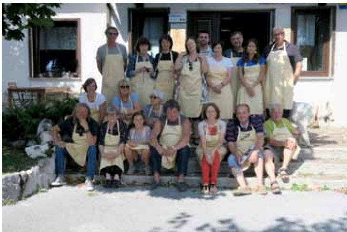
Prvi dan kolonije ...