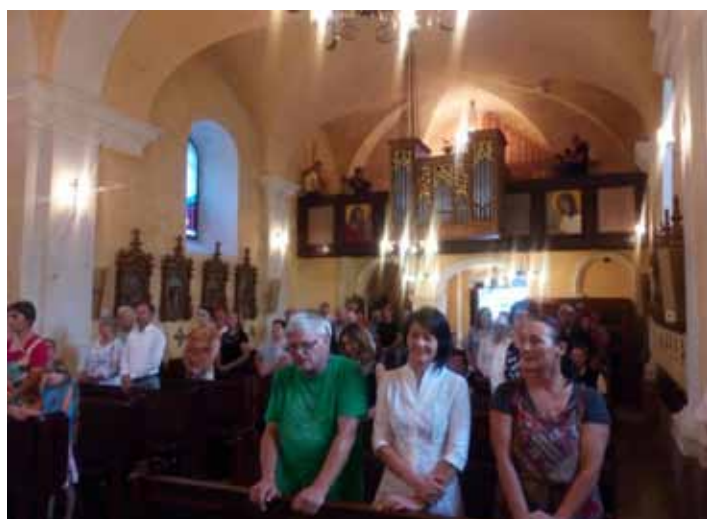
Maša za pokojne umetnike