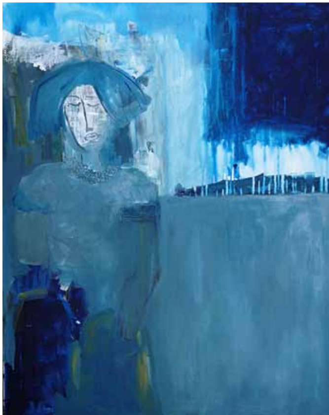
VIVIJANA KLJUN Sinja, 2018 akril na platnu

Vivijana Kljun je razpeta med Sežano in Trstom, že vse od mladosti pa z največjim veseljem domuje na področju likovnega ustvarjanja. Njen talent so opazili že v osnovni šoli, v gimnaziji pa je imela tudi svojo prvo razstavo. Kasneje je bila povezana z različnimi kreativnimi področji, od leta 2005 dalje pa sledimo njenemu slikarskemu delovanju in kontinuiranemu razstavljanju.