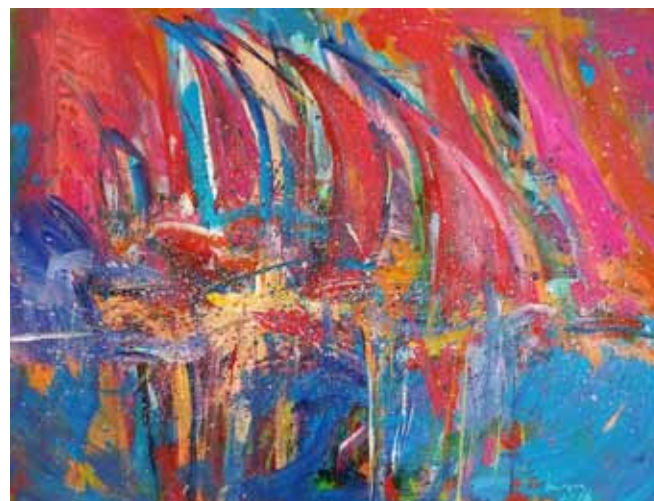
MIRA LIČEN KRMPOTIĆ Jadrnice, 2018 akril na platnu