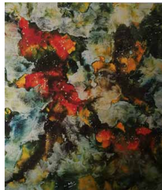
JANEZ ŠTROS Tudi ti si angel, 2018 olje na platnu