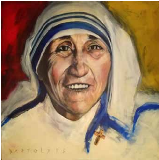
JOŽE BARTOLJ Mati Terezija, 2018 akril na platnu

Tudi mednarodna likovna kolonija Umetniki za karitas praznuje Cankarjevo leto. Ob 100. obletnici smrti največjega slovenskega pisatelja je potekala pod geslom