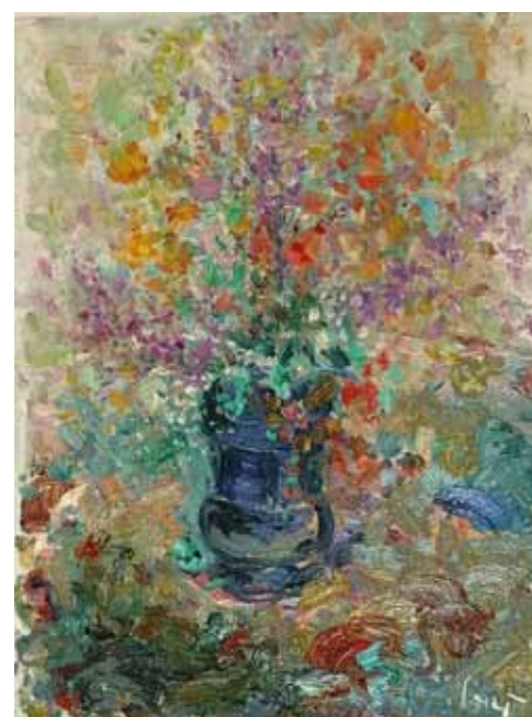
TO NE SEIFERT Šopek zate, 2018 olje na platnu