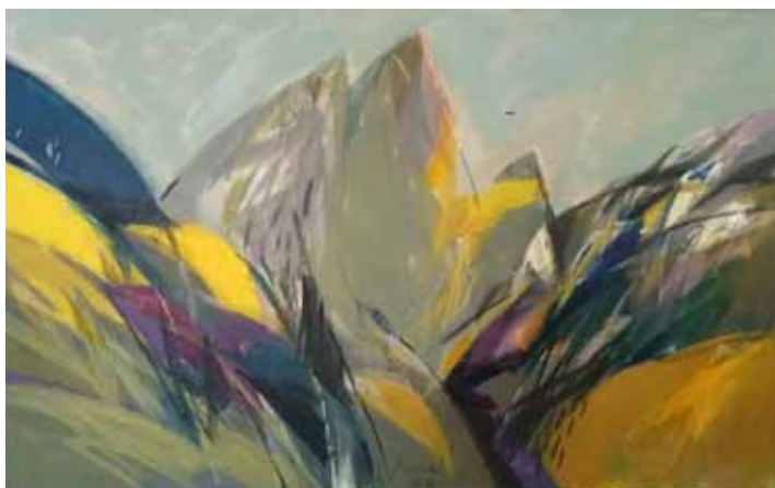
LUCIJAN BRATUŠ Gora, 2018 akril na platnu