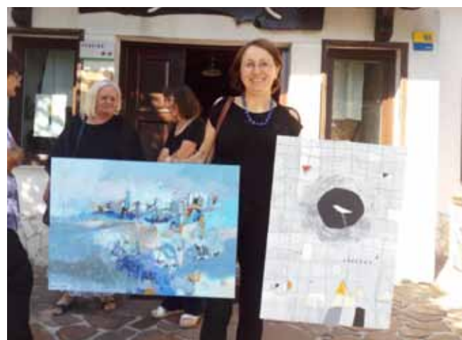
Nekateri slikajo kar doma in na dan odprtih vrat prinesejo svoj dar ...