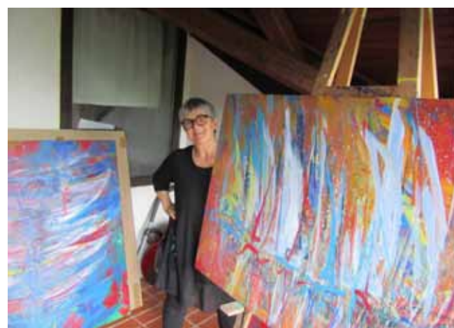
Mira v elementu ...