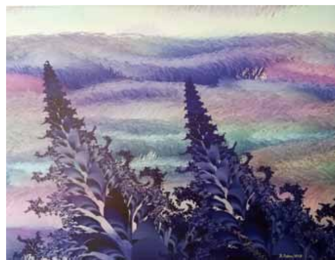
BOGDAN SOBAN Krajina, 2018 računalniška grafika