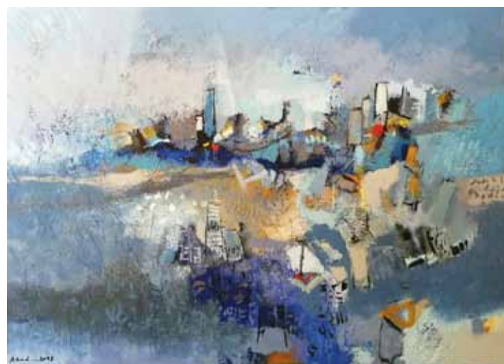
AZAD KARIM Dežela upanja, 2018 akril na platnu