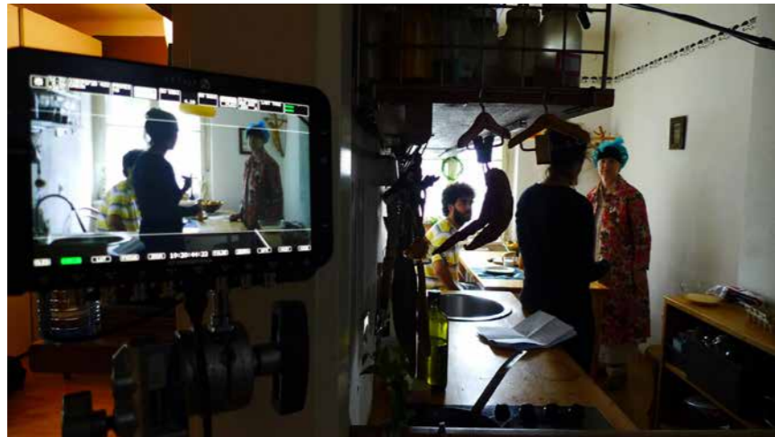
Utrinek iz snemanja.