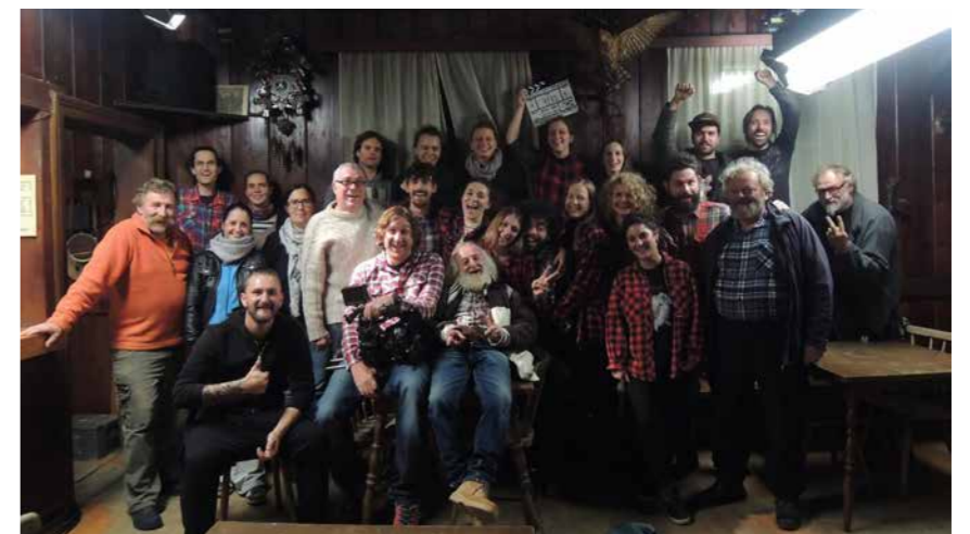
Utrinek iz snemanja.

Želim si, da bi razvoj trajal čim dlje, da lahko res temeljito raziščem temo in iz nje izluščim esenco. Pri ustvarjanju filmov je bistveno to, da imaš čas. Kar je narejeno na hitro nikoli ne more biti tako dobro.