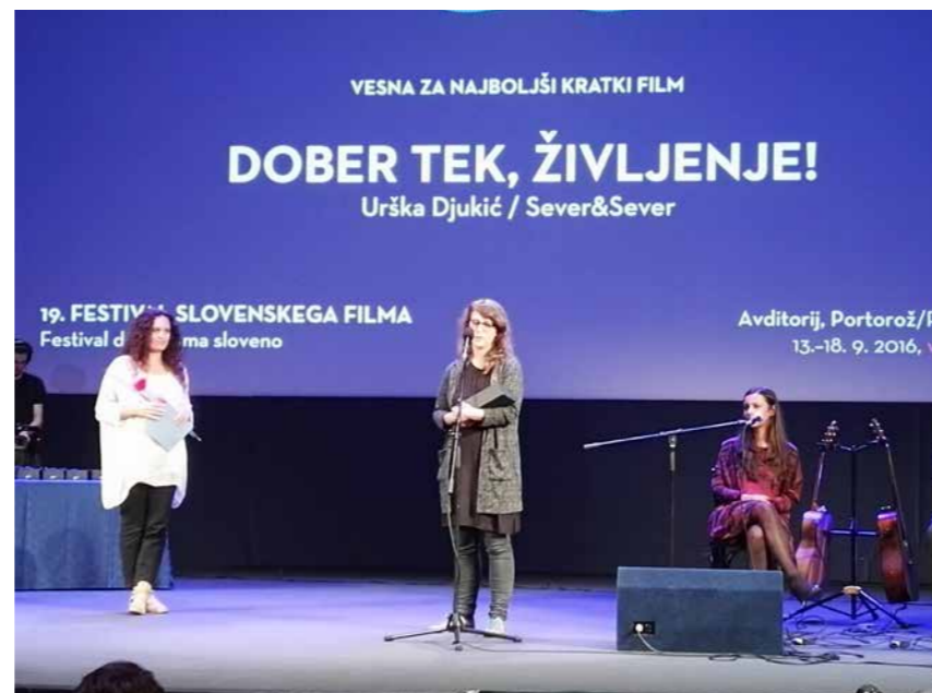
Nagrajenka ob prejemu nagrade »Vesna«.

Nisem pričakovala, da bodo ravno moj film nagradili, sem pa po tiho upala na kako manjšo nagrado, recimo posebno omembo žirije ali kaj podobnega. Zato sem bila zelo presenečena in zelo vesela, saj je to največja potrditev filmarju v Sloveniji, da dela dobro in da je na pravi poti. Upam, da bom s to referenco lažje dobila sredstva za svoje prihodnje projekte.